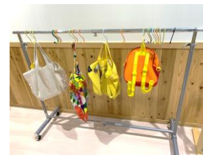
掛ける場所は自由です