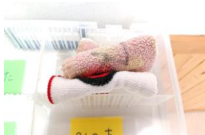
お名前のところに 2枚セットして下さい。